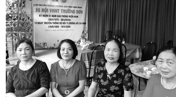
Các Đại biểu nữ dự Hội nghị

Trường Sơn khu vực Hà Nam tổ chức họp mặt kỷ niệm 51 năm giải phóng miền Nam (30/4/1975- 30/4/2026) và 67 năm Ngày Truyền thống Bộ đội Trường Sơn đường Hồ Chí Minh (19/5/1959 - 19/5/2026)