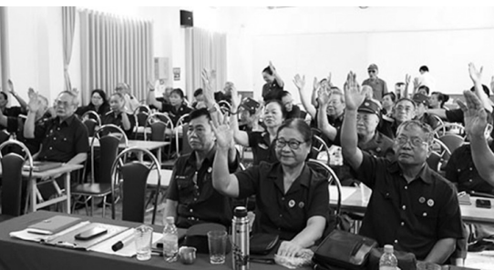
Các đại biểu thông qua Nghị quyết của BCH

Ngày 12/4/2026, tại Hải Phòng, BCH Hội Trường Sơn thành phố Hải Phòng tổ chức phiên họp lần thứ nhất, thể chế hóa nghị quyết Đại Hội lần thứ nhất Hội Trường Sơn thành phố nhiệm kỳ 2026 - 2031.