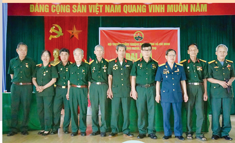
Ban CH Hội TS xã Đông Thành, Phú Thọ ra mắt Đại hội