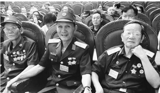
Các đại biểu dự Đại hội