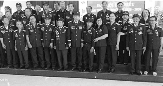
Ban CH Hội Trường Sơn Đắc Lắc nhiệm kỳ 2025-2030 ra mắt Đại hội

Ngày 11/4/2026 tại Đắc Lắc, Hội Truyền thống Trường Sơn - Đường Hồ Chí Minh tỉnh Đắc Lắc long trọng tổ chức Đại hội Đại biểu lần thứ nhất (2025 - 2030).