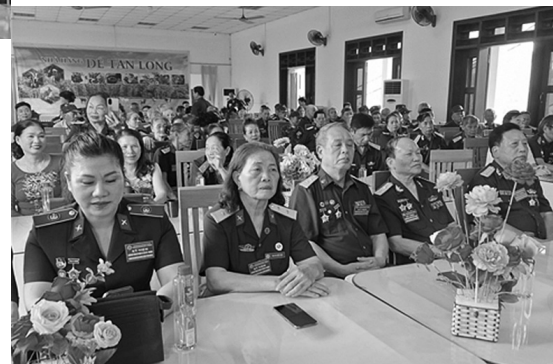
Các đại biểu dự Lễ kỉ niệm 56 năm thành lập sư đoàn 470 anh hùng