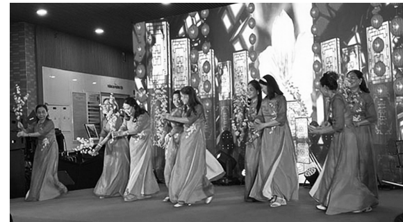
Tiết mục biểu diễn của Chi hội VHNTS Đà Nẵng

Dù mới thành lập được 3 năm, song cái tên Chi hội VHNT Trường Sơn Đà Nẵng đã trở nên thân quen với các cơ quan quản lý Văn hóa Nghệ thuật cũng như với quần chúng nhân dân thành phố Đà Nẵng.