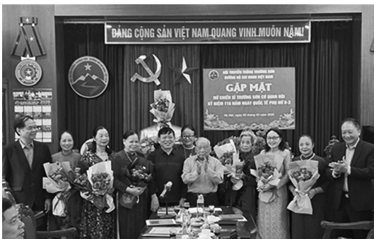
Chủ tịch Võ Sở tặng hoa và chúc mừng chị em Cơ quan Hội

Ngày 5/3/2026, Hội Trường Sơn Việt Nam (Hội TSVN) tổ chức gặp mặt kỷ niệm 116 năm Ngày Quốc tế Phụ nữ 8/3. Tới dự buổi gặp mặt có Thiếu tướng Võ Sở - Chủ tịch và các Phó Chủ tịch cùng cán bộ Cơ quan Trung ương Hội.