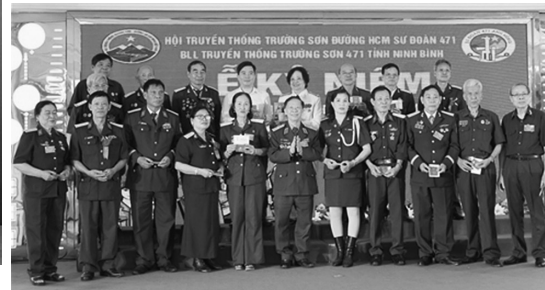
Thiếu tướng Hồ Sĩ Hậu trao tặng Kỷ niệm chương Đường ống Xăng dầu Trường Sơn cho các đại biểu

Trong 2 ngày 28 và 29 tháng 3 năm 2026, tại thành phố Ninh Bình, tỉnh Ninh Bình, Ban Liên lạc Sư đoàn 471 tỉnh