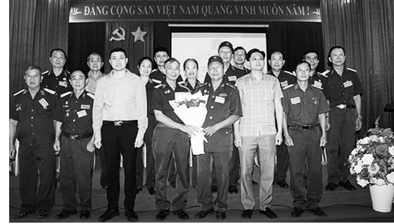
Lãnh đạo xã tặng hoa chúc mừng Ban Chấp hành mới