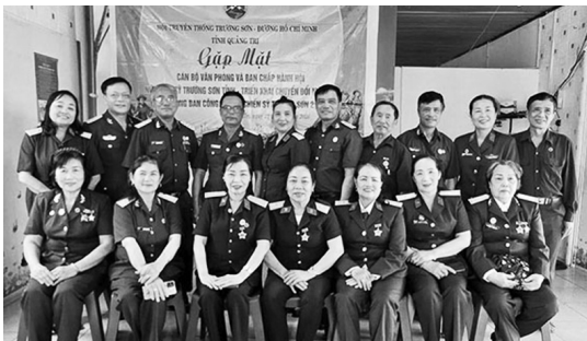
Các đại biểu chụp ảnh lưu niệm

Ngày 22 tháng 3 năm 2026, Hội TS tỉnh Quảng Trị tổ chức buổi “Gặp mặt Cán bộ văn phòng và BCH Hội Nữ chiến sĩ Trường Sơn tỉnh - Triển khai chuyên đổi mô hình hoạt động Ban Công tác Nữ chiến sĩ Trường Sơn 2 cấp.