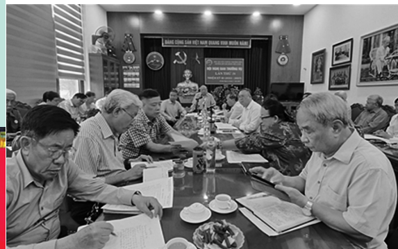
Toàn cảnh hội nghị

Sáng ngày 30/3/2026, tại Hà Nội, Hội Trường Sơn Việt Nam đã tổ chức Hội nghị Ban Thường vụ. Tham dự có các đồng chí Ủy viên Ban Thường vụ và các Ủy viên BCH Hội TSVN của Cơ quan.