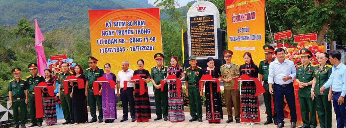
Ngày 24/4/2026 Ban Liên lạc E98, Lữ đoàn 98, UBND xã Đông Giang tổ chức Khánh thành Bia di tích đoạn đường Prao - Bến Giàng.