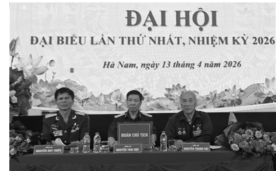
Đoàn Chủ tịch Đại hội

Sáng ngày 13/4/2026, tại Ninh Bình, Hội Trường Sơn phường Hà Nam tỉnh Ninh Bình long trọng tổ chức Đại hội Đại biểu lần thứ nhất, nhiệm kỳ 2026-2031.