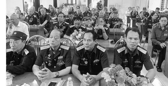
Các đại biểu dự Đại hội

Ngày 24/4, Hội Trường Sơn phường Bắc Giang, tỉnh Bắc Ninh đã long trọng tổ chức Đại hội lần thứ nhất, nhiệm kỳ 2026-2031 trong không khí trang nghiêm, đoàn kết và đầy nghĩa tình đồng đội.