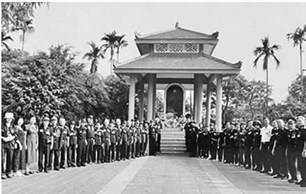
Đoàn thăm Khu lưu niệm Đại tướng Nguyễn Chí Thanh tại Huế

Nhân kỷ niệm 51 năm ngày giải phóng Huế - Đà Nẵng (26, 29/3/1975 – 26, 29/3/2026), Hội Truyền thống Trường