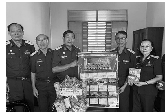
Ban Liên lạc Trường Sơn TP. Hồ Chí Minh thăm và chúc Tết Chi nhánh phía Nam - Binh đoàn 12

Hằng năm Ban liên lạc Trường Sơn thành phố Hồ Chí Minh có hai đợt hoạt động tiêu biểu: Ngày 27/7 - ngày Thương binh Liệt sĩ có phong trào “tri ân đồng đội” và mỗi khi Tết đến xuân về có phong trào “Xuân yêu thương, nghĩa tình đồng đội” được khơi dậy như mệnh lệnh từ trái tim của hội viên Ban liên lạc Trường Sơn TPHCM.