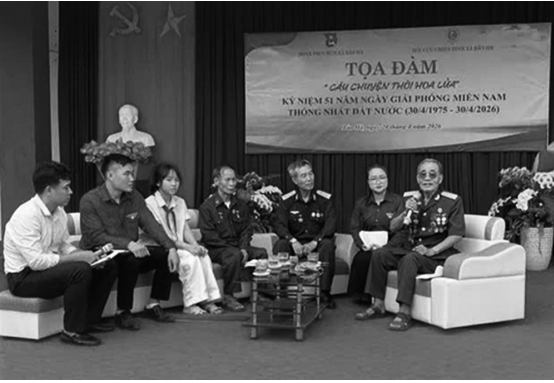
Các nhân chứng lịch sử chia sẻ về những năm tháng chiến đấu tại chương trình tọa đàm

Ngày 20/4/2026, hướng tới kỷ niệm 51 năm ngày Giải phóng miền Nam (30/4/1975 - 30/4/2026) phối hợp cùng hội Cựu chiến binh và Đoàn Thanh niên cộng sản Hồ Chí Minh xã Bảo Hà, Hội Trường Sơn xã Bảo Hà tổ chức buổi tọa đàm giao lưu với các thầy, cô giáo, học sinh, thanh, thiếu niên Trường Phổ thông Dân tộc bán trú Trung học cơ sở xã Bảo Hà với chủ đề “Câu chuyện thời hoa lửa”.