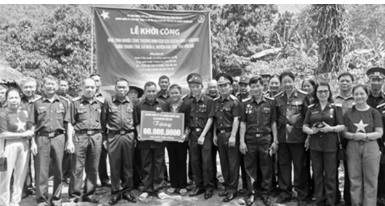
Trao kinh phí xây nhà tình nghĩa cho hội viên tại xã Mậu A

Trong năm 2025 và đầu năm 2026, Hội Trường Sơn tỉnh Lào Cai đã có nhiều cách làm sáng tạo, vận dụng phù hợp với điều kiện để huy động tốt nhất nguồn lực xã hội để tổ chức các hoạt động tri ân, đậm chất nhân văn: “Uống nước, nhớ nguồn”.