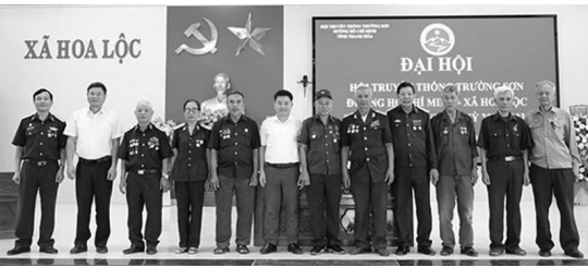
Ban Chấp hành mới ra mắt trước Đại hội

Đoàn Chủ tịch đã trình bày bản: “Báo cáo quá trình kiện toàn sát nhập, hợp nhất tổ chức Hội; Phương hướng hoạt động của Hội nhiệm kỳ 2026- 2031”