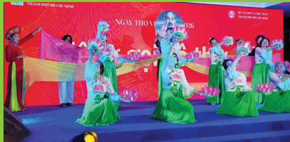
Câu lạc bộ VHNT Hội Trường Sơn TP. Hồ Chí Minh biểu diễn trong ngày Thơ của Thành phố