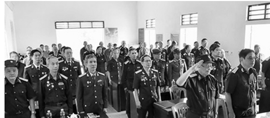
Các đại biểu trang trọng tiến hành Lễ Chào cờ

Sáng ngày 17/3/2026 Đại hội lần nhất của Hội Trường Sơn xã Đông Thành, tỉnh Phú Thọ Lần thứ nhất - Nhiệm kỳ 2026 -2031 diễn ra trang trọng và đầm ấm.