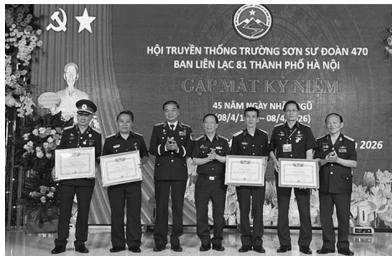
Lãnh đạo Hội TSVN tặng bằng khen cho các cá nhân xuất sắc

Sáng ngày 8 tháng 4 năm 2026, tại Hà Nội; Ban liên lạc Truyền thống CCB Hà Nội nhập ngũ 1981, đơn vị được bổ xung về Sư đoàn 470 anh hùng, tổ chức trọng thể Gặp mặt kỷ niệm 45 năm Ngày nhập ngũ (8/4/1981- 8/4/2026).