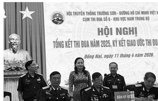
Các đơn vị ký kết Giao ước Thi đua năm 2026

Sáng ngày 11/4/2026, tại Hội trường Lữ đoàn 972/ Tổng cục HC-KT (tỉnh Đồng Nai). Cụm thi đua số 6 (khu vực Nam Trung bộ), do Hội Trường Sơn tỉnh Đồng Nai làm Cụm trưởng đã tổ chức Tổng kết thi đua năm 2025 và ký giao ước thi đua 2026.