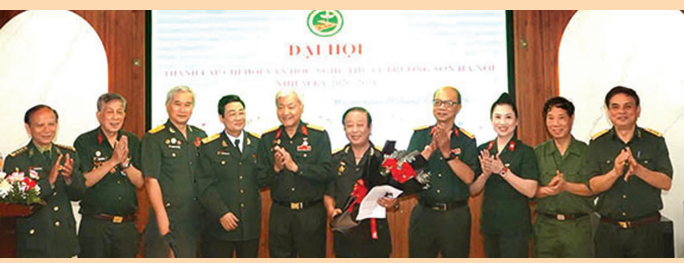
Ban Chấp hành Chi Hội VHNT Trường Sơn Hà Nội