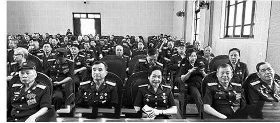
Các đại biểu dự Đại hội