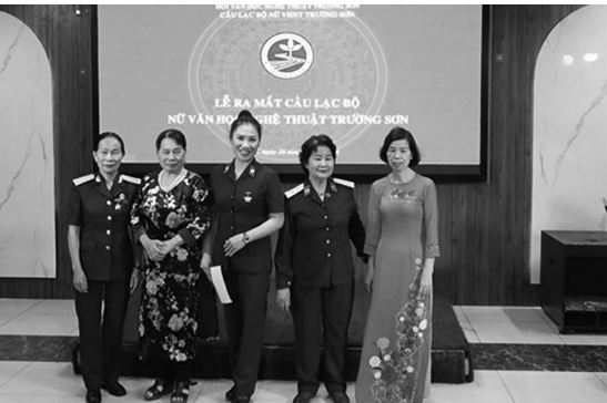
Ban Chủ nhiệm CLB Nữ VH-NT TS nhiệm kỳ 2026-2031

Sáng ngày 28 tháng 3 năm 2026, tại Hà Nội đã diễn ra Lễ ra mắt Câu lạc bộ Nữ VHNT thuộc Hội VHNT Trường Sơn.