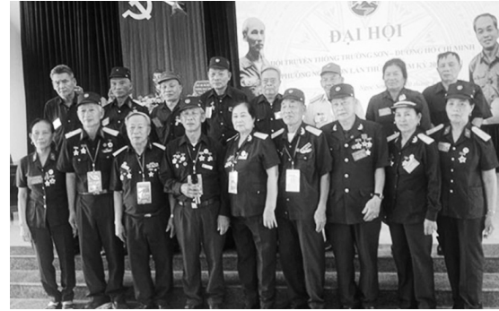
Ban chấp hành mới ra mắt trước Đại hội

Ngày 10/4/2026, tại Hội trường UBND phường Ngọc Sơn, Hội Trường Sơn phường Ngọc Sơn đã long trọng tổ chức Đại hội lần thứ nhất, nhiệm kỳ 2026- 2031.