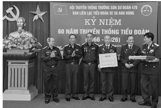
Trao Bằng khen cho Tập thể xuất sắc ( BLL d58)

Sáng ngày 01 tháng 4 năm 2026, tại Bảo tàng Phòng không-Không quân, Hà Nội; Ban liên lạc Truyền thống Tiểu đoàn xe 58 anh hùng, đơn vị trực thuộc Sư đoàn 470, tổ chức trọng thể Lễ kỷ