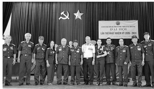
Ban Chấp hành Hội TS phường Việt Yên ra mắt Đại hội

Ngày 25 tháng 3 năm 2026, Hội Truyền thống Trường Sơn đường Hồ Chí Minh phường Việt Yên, tỉnh Bắc Ninh đã long trọng tổ chức Đại hội lần thứ nhất, nhiệm kỳ 2026 - 2031.