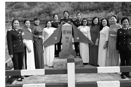
Đoàn chụp ảnh lưu niệm tại cột mốc Biên giới, đồn Biên phòng A Mú Sung

Từ ngày 8/3 đến 11/3/2026, được thống nhất của Chủ tịch Hội Trường Sơn tỉnh Lào Cai và Bộ chỉ huy Quân sự tỉnh Lào Cai, CLB Nghệ thuật Hội Trường Sơn tỉnh Lào Cai đã đến thăm quan và biểu diễn văn nghệ phục vụ cán bộ, chiến sĩ các đồn Biên phòng và bà con nhân dân vùng biên giới tỉnh Lào Cai.