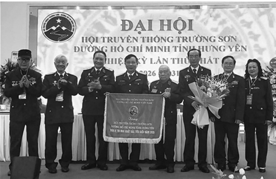
Thiếu tướng Võ Sở, tặng Cờ Thi đưa cho Hội Trường Sơn tỉnh Hưng Yên

Ngày 26 và 27/2/2026, Hội Trường Sơn tỉnh Hưng Yên (từ Hội TS Thái Bình và Hội TS Hưng Yên cũ sáp nhập) long trọng tổ chức Đại hội đại biểu lần thứ I, nhiệm kỳ 2026 - 2031. Đến dự và chỉ đạo Đại hội có Thiếu tướng Võ Sở - Chủ tịch; Thiếu tướng Hoàng